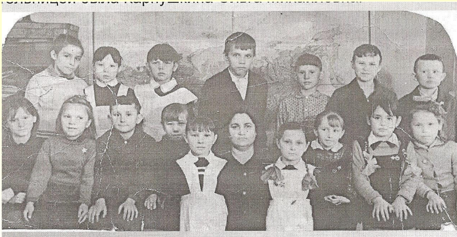
Первый выпуск Кошелевской школы